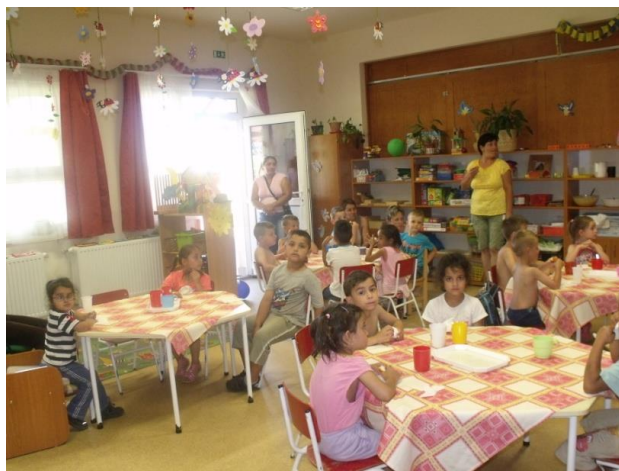
Mindenkinek ízlett a fánk és az ivólé