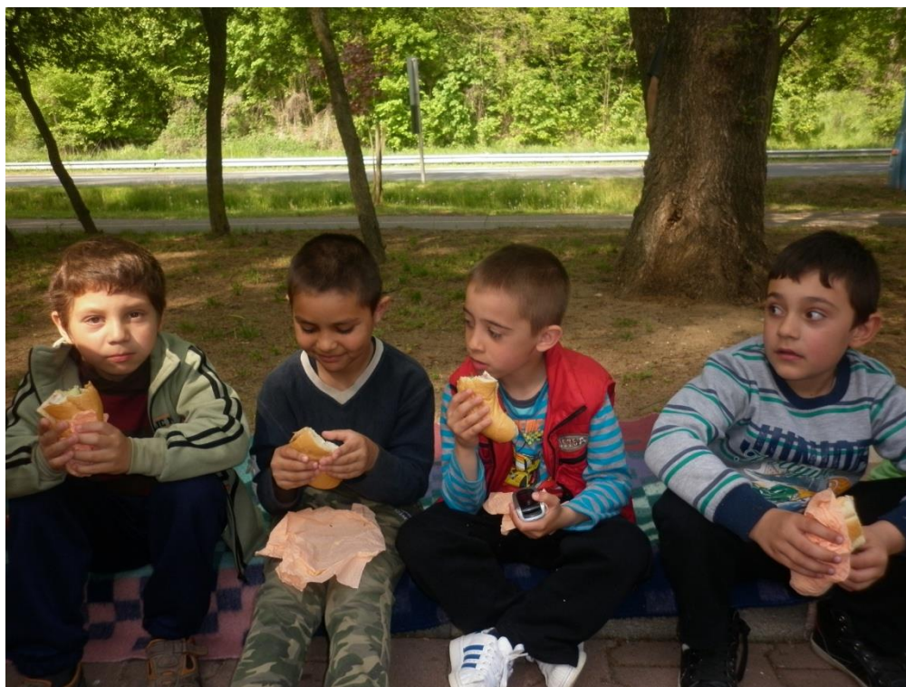
Tízórai az állatok közelében