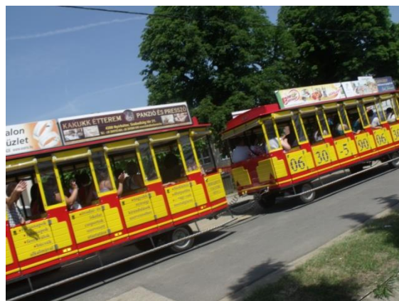
Utazás a kisonattal